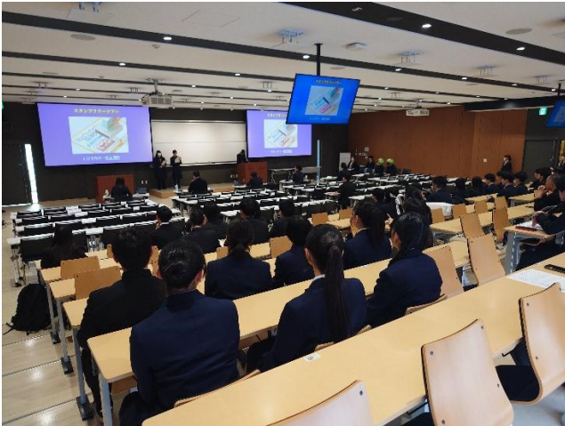
会場（札幌学院大学新札幌キャンパス）の様子①