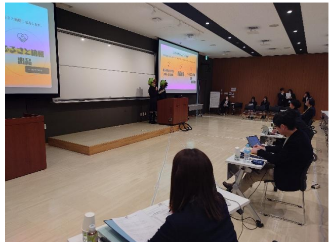
会場（札幌学院大学新札幌キャンパス）の様子②